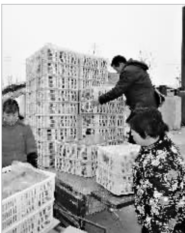
商贩在贩运蘑菇。