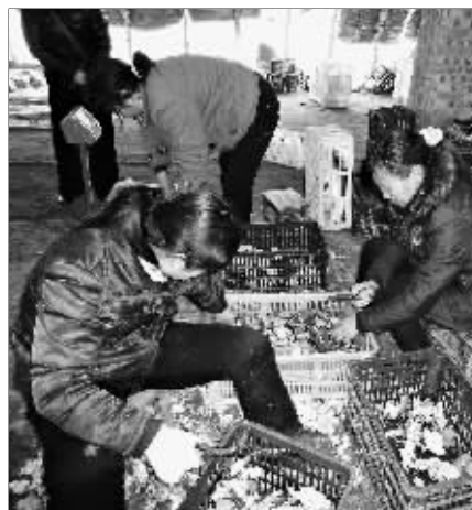
村民们在修剪蘑菇。