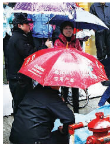
路人与民警为老人撑伞。

天下着雨,一个老人突然倒地,安详地走了。路人看到了,纷纷停下给老人撑伞。他们中有警察,有百货店的员工,都是素不相识的人。