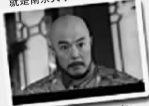
皇阿玛:寝室的锅怎么回事? 紫薇:我们被食堂的人群挤垮了……