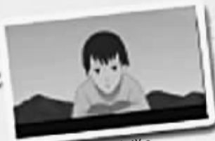
南京大学是哪个大学? 就是南京大学啊。

这部配音作品在网上一经传开就获得了超高的点击率与分享率,帖子也很快被顶上南大小百合论坛的十大热帖。跟帖的同学们纷纷表示“赞!”、“力顶!帆母V5!”、“MM声音好甜。”众多网友也感慨,现在的学生真有才,“真想见一下配音的同学们”。(据《扬子晚报》)