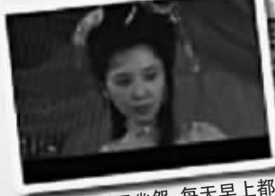
女儿国国王幽怨:每天早上都要 刷卡,希望嫁给唐僧,让唐僧帮她刷。