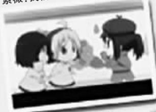
14个通识学分,好难啊