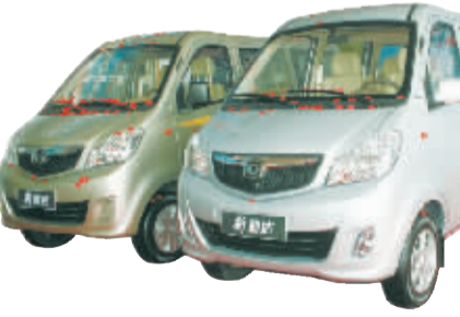
福仕达新腾达和新鸿达。

福仕达新鸿达,定位中级精品微客,实用性能实现全面提升,3905mm的车身长度,配以2515mm轴距,拥有更大商乘空间;M系列发动机的配备,动力强劲,经济实用,综合工况百公里油耗仅为6.0升,较传统微客动力提升20%,油耗节省15%。福仕达新鸿达同样延续了福仕达的时尚动感的外观、轿车化的内饰、以人为本的安全等优点,完全满足消费者对微车的价值期待。