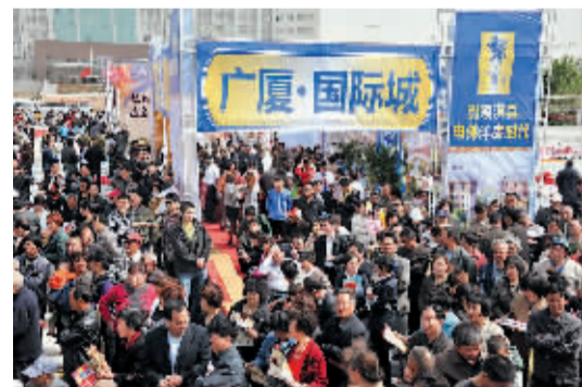
广厦·国际城展区吸引了不少参展者。