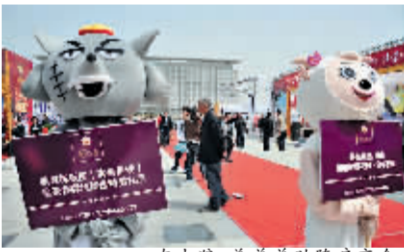
变脸表演。车技表演。灰太狼、美羊羊助阵房交会。