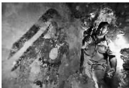
萨图尔诺在遗址内。

考古人员发现,另一面墙上以月相记录的日历大约13年。美联社10日报道,这种记录让抄写员能提前数年预测满月,对玛雅占星术和各种典礼起着重要作用,还可能用于建议统治者何时发动战争等。