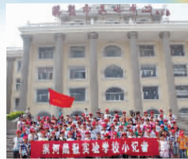
小记者们在市博物馆前合影。