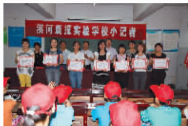
小记者站向聘请的辅导老师颁发证书。