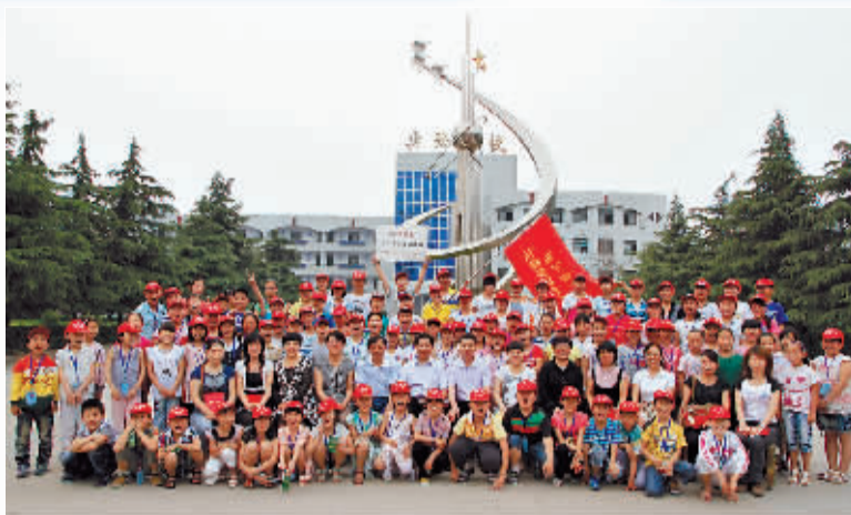
实验学校小记者和领导、老师合影留念。

据悉,实验学校旨在通过这样一个平台,提升学生们的观察能力、写作能力、语言表达能力、社会交往能力等,使学生们养成勤于读书、善于观察、乐于写作的好习惯。另外,学校还专门选拔了一批责任心强、爱好写作、有一定协调能力的老师担任小记者站辅导教师工作,组织、领导小记者开展活动,并向报社推荐小记者的优秀作品。