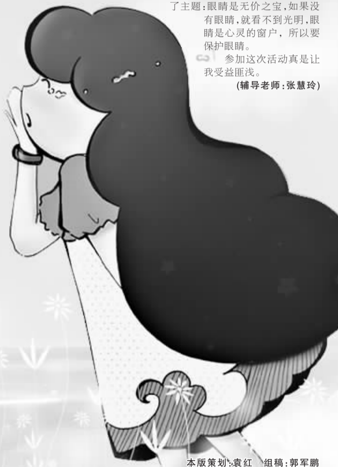
本版策划:袁红 组稿:郭军鹏