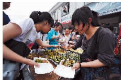
有些没有家长陪读的学生就在学校周边的小饭馆解决午餐,盘活了整个毛坦厂镇的经济。为了吸引学生,镇子上一些商店干脆起名叫“状元店”。