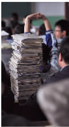
高三学子的课桌上,书籍堆积如山。在这里,“书山有路勤为径”得到了最好的阐释。

甘肃省会宁县十年九旱,资源匮乏,却是全国闻名的“高考状元县”。截至2012年,全县已累计向各大中专院校输送7万多名学生。对于毫无选择的会宁贫苦家庭来说,仍将高考看做化解一切苦难的解药,为此他们押上了生活的全部。到大学去!这是会宁人共同的精神支柱。