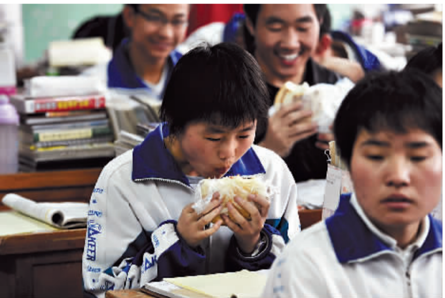
早晨7点,早操结束后,学生们回到教室准备上课。一名高三女孩一边啃大饼,一边温习功课。大饼都是家长在乡下做好,托长途车捎来的,一次捎一周的量。功课太紧张,孩子们周末都不回家。一日三餐全吃干饼子,是会宁不少学生的食谱。