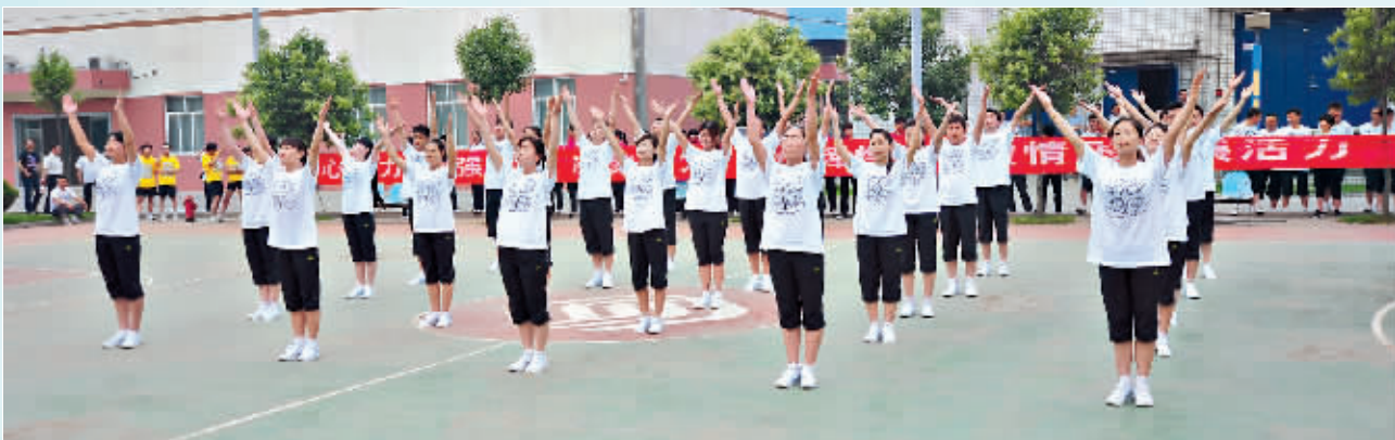
员工进行工间操表演。