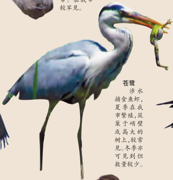
苍鹭 涉水捕食鱼虾,夏季在我市繁殖,筑巢于峭壁或高大的树上,较常见。冬季亦可可见到但数量较少。