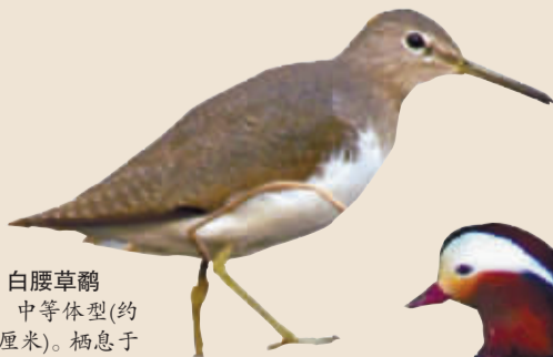
白腰草鹳 中等体型(约23厘米)。栖息于池塘及河流。在我市较常见。