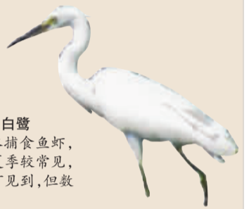
小白鹭 涉水捕食鱼虾,在我市夏季较常见,冬季亦可可见到,但数量较少。