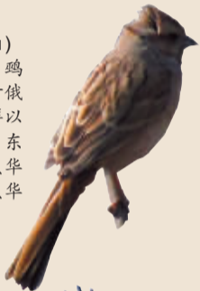
苇鸛(wú) 小型鸣鸟。分布于俄罗斯、朝鲜以及中国的东北、西北、华北、华中、华东等地。