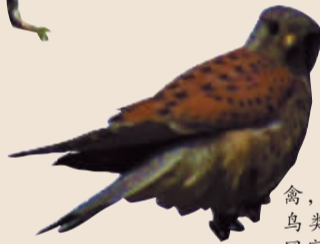
红隼 食肉猛禽,捕食小型鸟类及鼠类,国家二级保护动物。在我市较常见。