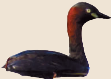
小鸛鹳(pi tī) 栖息于湖泊、沼泽及河流地带,善于潜水。在我市多处水域常年可见。