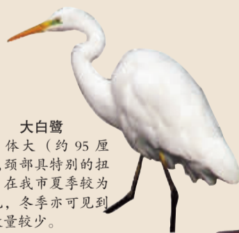
大白鹭 体大(约95厘米),颈部具特别的扭结。在我市夏季较为常见,冬季亦可可见到但数量较少。