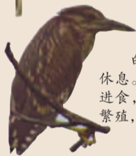
夜鹭 白天群栖树上休息。黄昏时分分散进食,夏季在我市繁殖,较常见。