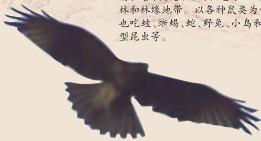
鸛(kuáng) 代表性物种普通鸛。飞翔时两翼宽阔,微向上举成浅“V”字形。性情机警,视觉敏锐,栖息于山地森林和林缘地带。以各种鼠类为食,也吃蛙、蜥蜴、蛇、野兔、小鸟和大型昆虫等。