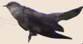
大杜鹃 中等体型(约32厘米)繁殖时不筑巢,常将卵产于苇莺等小鸟的巢中。俗名:布谷鸟,在我市属夏候鸟。