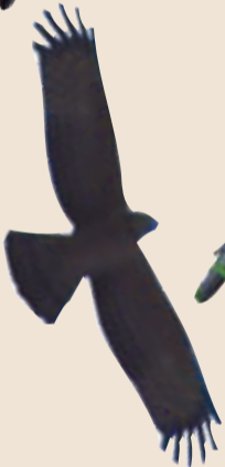
凤头蜂鹰 嗜吃蜜蜂及蜂巢,国家二级保护动物。繁殖于黑龙江至辽宁,冬季经华中及华东迁至台湾、东南各省及海南岛。迁徙时途经我市,较为罕见。