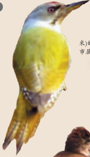
灰头绿啄木鸟 中等体型(约27厘米)的绿色啄木鸟。在我市属留鸟,较常见。