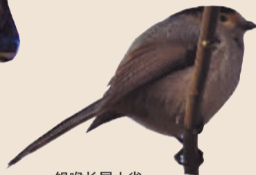
银喉长尾山雀 中国东北、华北、华中、华东及西南地区的留鸟,较常见。