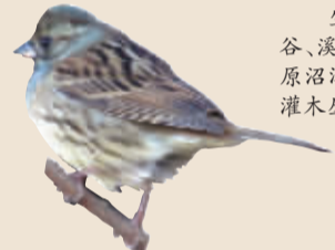
灰头鸛(wú) 生活于山区河谷、溪流两岸,或平原沼泽地的疏林和灌木丛中。