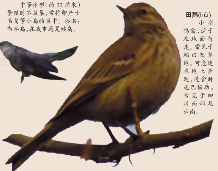
田鸛(liù) 小型鸣禽,适于在地面行走。常见于稻田及草地。可急速在地上奔跑,进食时尾巴摇动。常见于四川南部及云南。