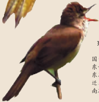
东方大苇莺 常见于我国新疆北部和东部至华中、华东及东南地区。迁徙时见于华南及台湾。