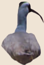
鸛嘴鹳 栖于高海拔地区多石头、流速快的河流地带。在我市较罕见。