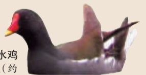
黑水鸡 中等体型(约31厘米),栖息于湖泊、池塘及河流边植被茂密处。在我市较常见。