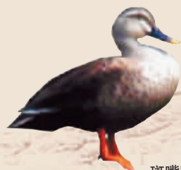
斑嘴鸭 雄鸟体长约60厘米,雌鸟体型稍小,两性羽色近似,棕褐色。喙黑色,尖端黄色。在我市四季均可见到。