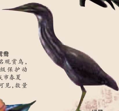
绿鹭 栖于池塘、溪流及芦苇丛。