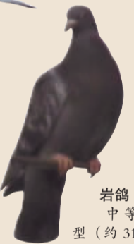
岩鸽 中等体型(约31厘米)的灰色鸽。翼上具两道黑色横斑。与原鸽十分相似,但腹部及背部颜色较浅。群栖于多崖洞的峭壁。在我市较常见。