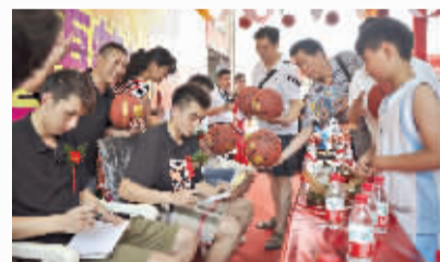
东莞马可波罗队球员为球迷签名。

晨报讯(记者 康迎风/文)6月23日上午,“马可波罗”携手 CBA 球星大型签售会在鹤壁马可波罗磁砖至尊殿举行。为了答谢广大消费者对马可波罗品牌的支持和喜爱,此次签售活动,主办方准备了价值不菲的产品回馈鹤壁消费者,让前来选购的消费者大呼过瘾。