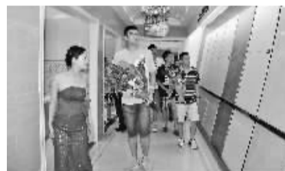
球员在马可波罗磁砖至尊殿内参观。