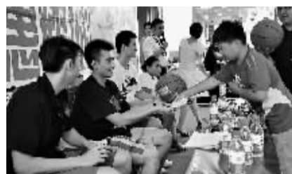
东莞马可波罗队球员为球迷签名。