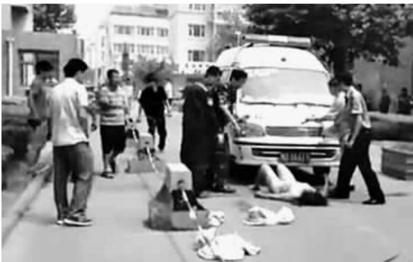
肇事司机裸身躺在救护车前阻挠。