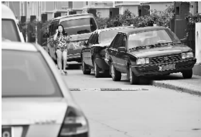
7月5日,新区一居民区外,多辆机动车停放于非机动车道上。