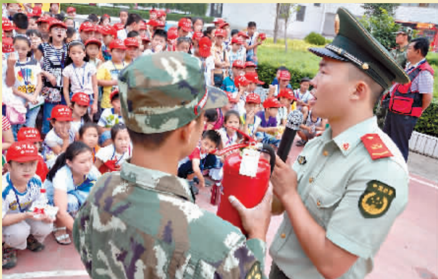
消防战士在介绍灭火器材的使用方法。