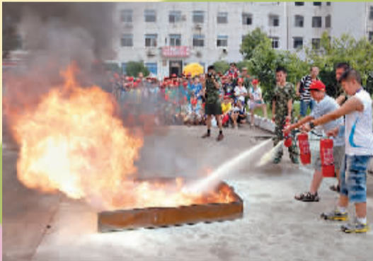
小记者体验灭火过。