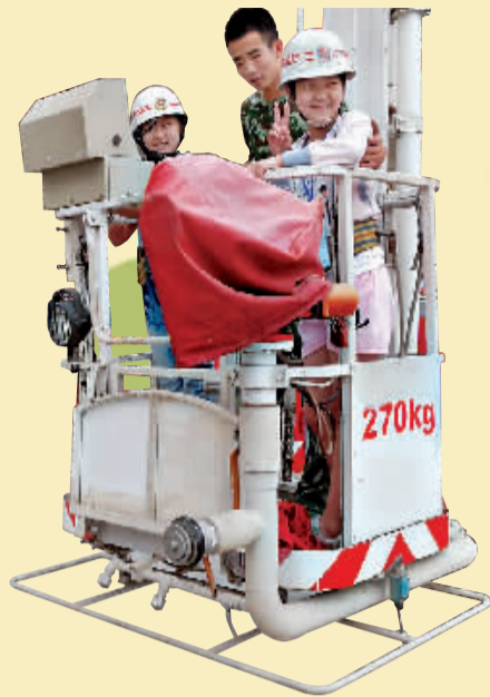
乘坐登高平台消防车的小记者。