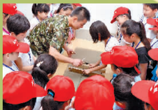
消防战士教小记者叠被子。