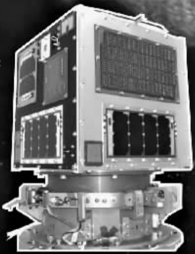
“凤龙2号”高电压技术演示卫星

新华社东京7月11日电(记者 蓝建中)日本九州工业大学10日宣布,由该校研制的小型卫星“凤龙2号”在太空利用太阳能电池首次成功实现了300伏特的高电压发电。