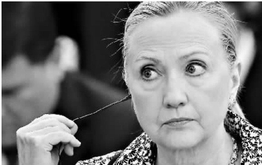
7月8日,美国国务卿希拉里出席在日本东京举行的阿富汗重建问题国际会议。

有分析认为,长期以来,蒙古积极推行所谓“第三邻国”政策,为了平衡对中国及俄罗斯的依赖,蒙古国一直寻求扩大与美国的合作。美国现已提供数亿美元援助款给蒙古。