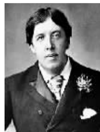
奥斯卡·王尔德 (1854 ~ 1900 年)

然而,拿破仑在三场主要战役中失利:卡德耶罗战役、阿斯珀恩-埃斯灵会战和滑铁卢战役。即使是一些取胜的战斗,比如奥斯特里茨战役和瓦伦哥战役,也是势均力敌,拿破仑的胜利更多靠的是运气而不是判断力。不过,最大的败绩还是 1812 年发动的对俄战争。拿破仑在这场战争中不是被敌军的指挥官,而是被俄罗斯冬季的严寒和糟糕的后勤所打败。虽然在伯罗的诺打败了敌人,但这次胜利代价不菲,法国军队损失了 35000 人。拿破仑出发攻打俄国时有一支 40 万人的军队,但最后只剩下不到 1 万人。