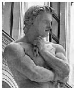
斯巴达克斯 (? ~ 公元前 71 年)

世界历史上的名人灿若星辰,他们的丰功伟绩被人们歌颂和赞扬,但是否有一些历史名人的“丰功伟绩”是“名不副实”的呢?英国《BBC 历史》杂志的记者们采访了很多学者,让他们选出他们心目中被高估的历史名人。