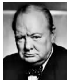
温斯顿·丘吉尔 (1874 ~ 1965 年)

他的一些文章,显得幼稚甚至可笑。虽然他的一些书和戏剧作品确实令人赞叹,但他真的不像他的支持者所认为的那样是一个完美无瑕的圣人。