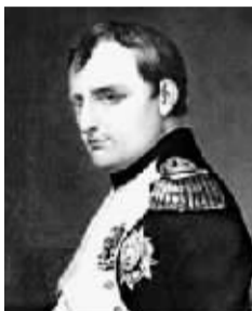
拿破仑·波拿巴 (1769 ~ 1821 年)

斯巴达克斯带领不同肤色和种族的奴隶向着意大利与高卢边境进发寻找自由。但是,奴隶的队伍最终又挥师南下,返回意大利,这是致命的错误。斯巴达克斯是色雷斯人,曾在罗马军队里服役。他应该知道罗马军队是一支永不言败的军队。敌人的进攻越凶猛,他们的反攻越有力。不过,与汉尼拔一样,斯巴达克斯对于这一点知道得太晚了。公元前 71 年,罗马军队歼灭了斯巴达克斯的奴隶队伍,被俘的奴隶被钉死在亚壁古道两旁的十字架上。斯巴达克斯和奴隶们的抗争,最终归于尘土。