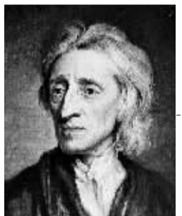
约翰·洛克 (1632 ~ 1704 年)

洛克很幸运,他幸运在于资料被很好地保存下来。大量的信件、著作的草稿、备忘录和其他笔记,还有很多畅销的哲学、政治理论和宗教方面的书籍,为后世研究思想史的历史学家开辟了“洛克产业”。