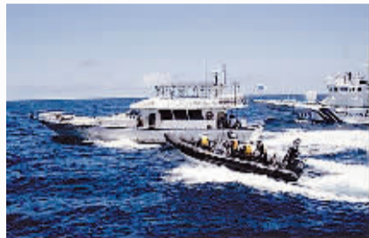
2012年7月4日,日方快艇试图驱赶“全家福号”。