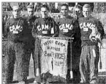
排球比赛获得第2名的队员合影。