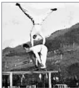
韩国运动员在双杠上表演。