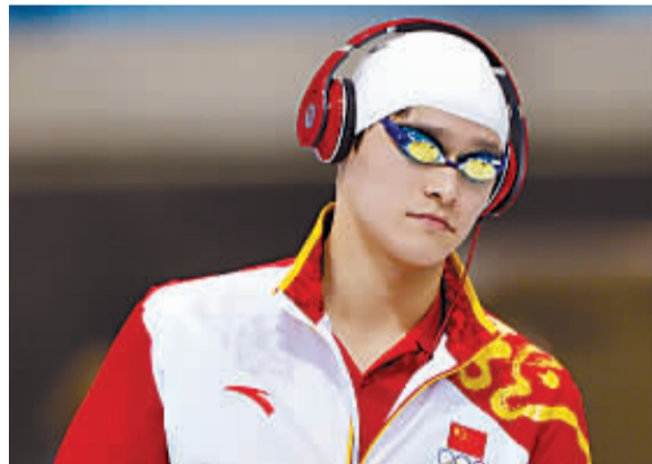
孙杨头戴 Beats By Dr.Dre 耳机。

和此次伦敦奥运的大部分游泳选手一样，直到比赛前最后一刻，孙杨都会一直戴着副硕大的 Beats By Dr.Dre 耳机，这款耳机来自 Monster(魔音)品牌，由美国说唱巨星 Dr. Dre 代言，能屏蔽一切外部杂音，此前已在足球和篮球运动员中大规模风行。美国游泳名将菲尔普斯是这款耳机的头号粉丝，他甚至在训练时都放不下它。