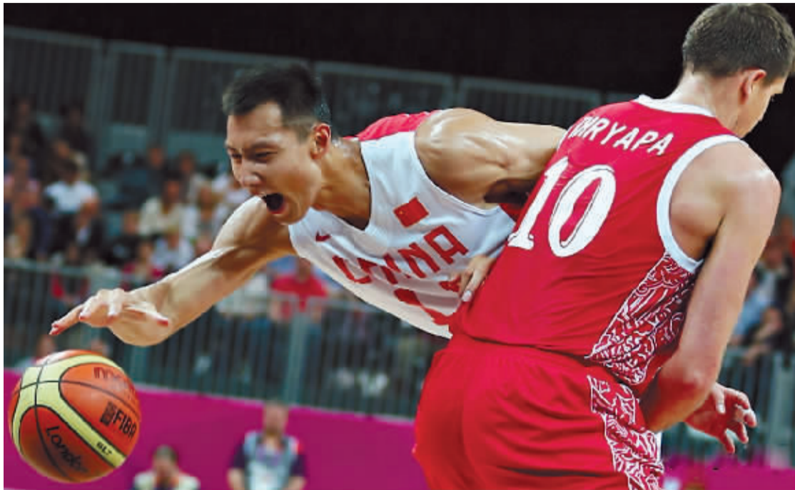
易建联在比赛中。

2012年8月1日 星期三 编辑 / 邓叶染 美编 / 张帅 TEL: 0392-2189920 E-mail: dengyeran@126.com