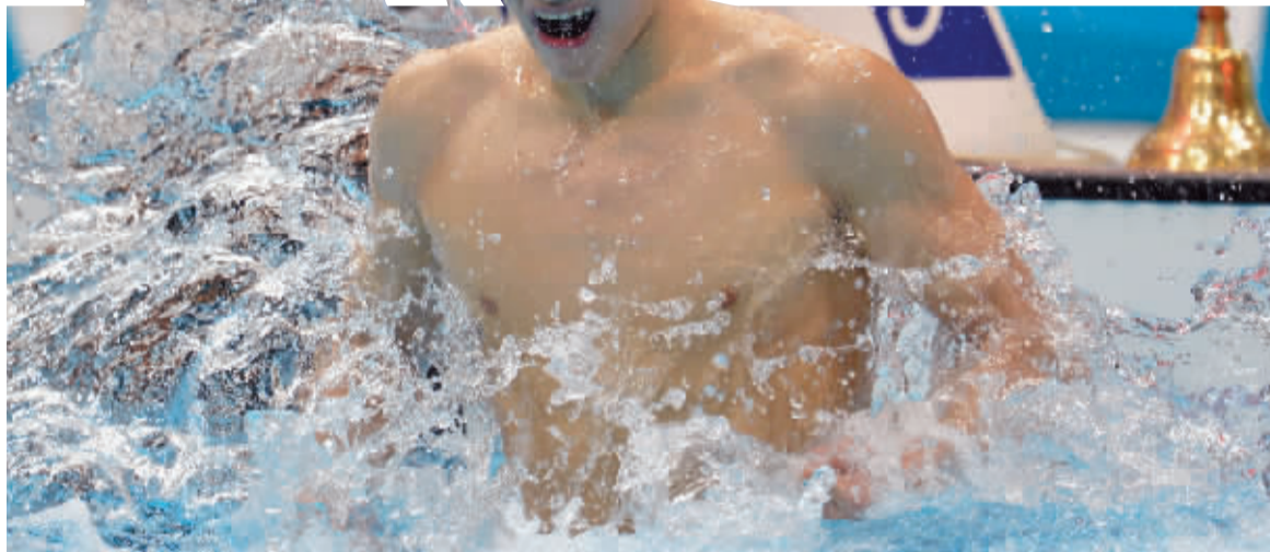
当地时间8月4日,中国选手孙杨在获胜后庆祝。

北京时间昨晚孙杨以打破世界纪录的表现,夺得伦敦奥运会个人第二枚金牌、第四枚奖牌,这使他成为继李宁之后,中国在一届奥运会获得奖牌第二多的运动员。但这些还不足够惊人,因为在这场男子1500米自由泳比赛中,孙杨体现出三“惊”!