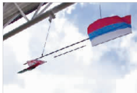
在网球女单颁奖仪式上美国国旗被大风吹走。