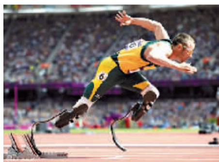
男子400米比赛中的“刀锋”战士。

25岁的南非田径运动员奥斯卡·皮斯托瑞斯有“刀锋战士”的美誉,4日,他在男子400米比赛中跑出个人今年最好成绩45秒44,以小组第2的身份闯进半决赛。