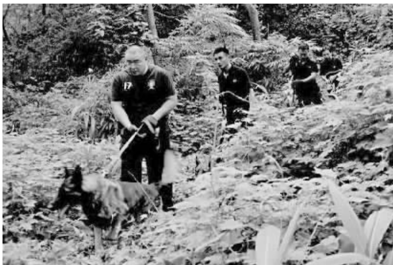
特警牵着警犬,在密林里搜索犯罪嫌疑人周克华的踪影。

重庆警方表示将对公安机关抓获或击毙嫌犯提供直接线索的市民,奖励50万元。公安部随后发出A级通缉令,并悬赏10万元。