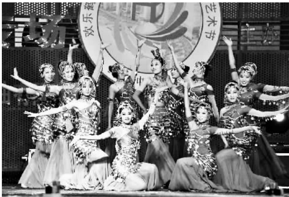
昨晚,第五届广场文化艺术节闭幕,图为闭幕式上的舞蹈《年年有余》。

颁奖仪式结束后,国税局专场为观众奉上了《金鼓迎宾》、《红红的日子》等14个精彩节目。