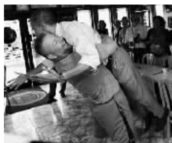
奥巴马在一家披萨店购买披萨时遭遇热情店主“熊抱”。

据中新网消息 据外电10日报道,美国总统奥巴马日前在佛罗里达州进行竞选活动时,在一家披萨店遭遇热情店主“熊抱”,这一互动瞬间被媒体捕捉并公布,在博得支持者会心一笑的同时,却也遭到很多反对者的抨击。