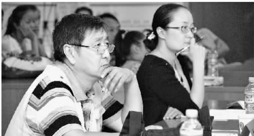
9月16日,在朗诵大赛初赛现场,评委们在认真欣赏表演。晨报记者 张志嵩 摄

晨报讯(记者 韩文雪)9月15日上午8时,为期两天的“珉格杯”第二届鹤壁市朗诵大赛初赛在鹤壁日报社五楼会议室如期举行,来自全市不同年龄、不同职业的199名选手通过声音的力量感染着在场的观众和评委,最终有56名选手脱颖而出晋级复赛。