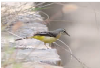
灰鹧鸪(jí lí ng)