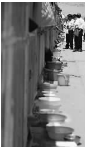
庙会上,众多行乞者将乞讨用的盆放在铁栏外。

对于外界批评,他认为应一分为二看,“如果不采取措施,一群人围着香客,人家可能又觉得我们没管理”;“主要是出于人身安全的考虑,防止出人命”。西山镇政府一位不愿透露姓名的工作人员,提供了类似的说法。