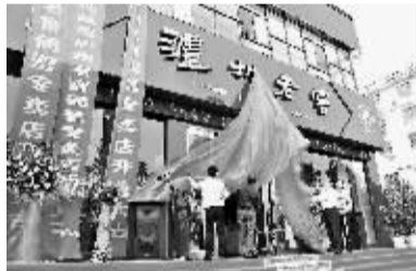
开业典礼现场。

宾馆举行了品鉴酒会。优雅的水墨书画舞蹈、极富观赏性的花式调酒、悠扬动听的萨克斯独奏、8位国际名模的酒品展示等表演让到场嘉宾更深刻地了解到泸州老窖产品的特色、历史和文化。