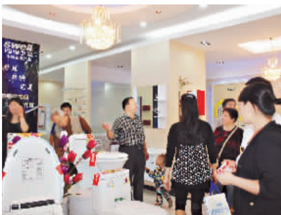
商家推出的优惠活动吸引了众多顾客。