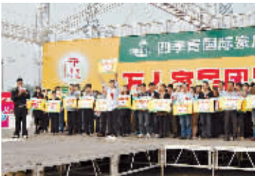
各厂商公布优惠活动内容。