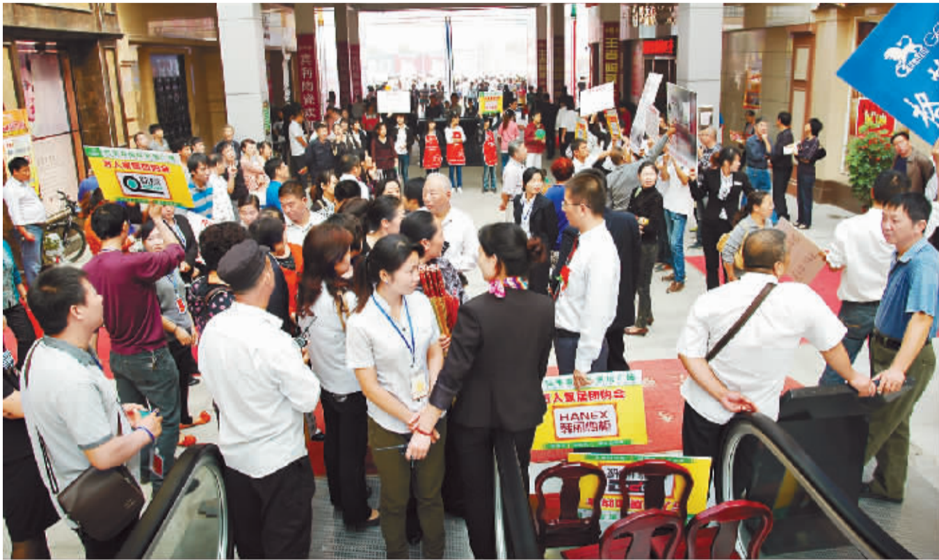
团购会开幕前,展馆前人头攒动。