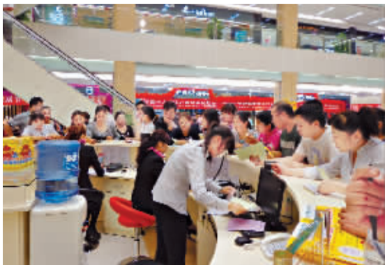
签单顾客在服务台办理手续。