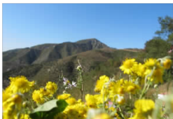
花香漫道。