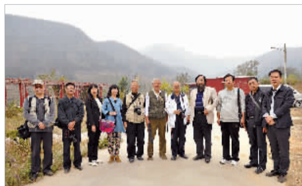
采风团成员合影。

10月15日,由10多名摄影爱好者和市作协会员共同组成的牟山采风团登顶牟山,开展采风活动。从牟山脚下沿盘山公路信步徐行,放眼四顾,深秋的牟山,金桔满枝,野菊遍地,淡淡花香,沁人心脾。远眺山腰有红叶秋树,零星点缀;近看衰草灌木间偶有野果成串,惹得飞鸟争食,叽叽喳喳。牟山深秋的美景使得摄影师们不由得停歇脚步,“喀嚓”不断。不觉牟山主峰已在眼前,山脊苍松翠柏,或一线排开,或密集成片,如将士列阵,威严有序。登顶后的兴奋惬意自不待言,四周群山连绵,层峦叠嶂,秋日美景,尽收眼底。作家们表示,要用最好的文字将这里的美景写入诗词,写入散文。