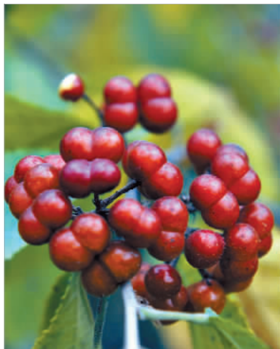
串串野果。