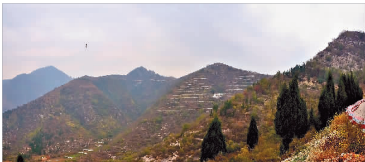
峰峦如聚。