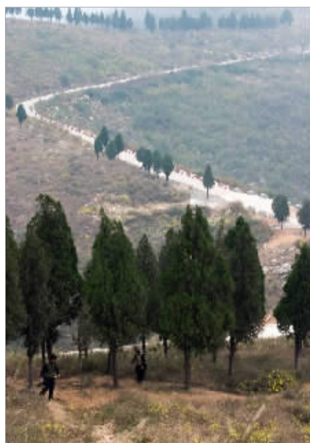
山间公路。