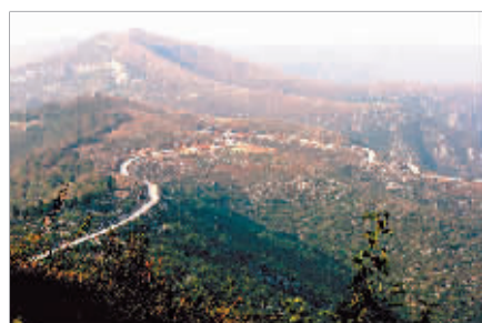
极目四望,心旷神怡。