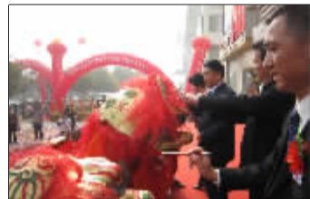
为舞狮点睛。

晨报讯(记者 渠稳)10月20日上午,位于淇滨区华夏南路的正阳家居广场上锣鼓喧天,紫府饰家奢华家居装饰馆在此举行开业典礼。