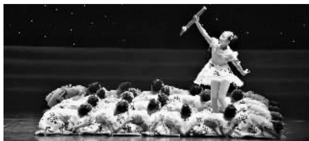
10月22日舞蹈专场现场。

晨报讯(记者 王帅)10月20日~22日,由省教育厅主办、市教育局承办的省第四届中小学生艺术展演活动在市艺术中心举行,我市选送的合唱《喊巴山,喊清江》、音乐剧《给我一缕春风》参加了艺术表演类节目现场展演。