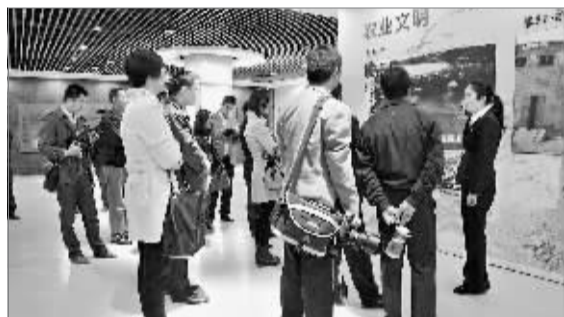
网友们在市文化中心看展览。

晨报讯(记者 贾正威)10月24日,由鹤壁宣传网和鹤壁网联合举办的首届“见证跨越发展,感受鹤城变化——鹤壁网友看鹤城”大型采风活动在淇滨区新世纪广场启动。