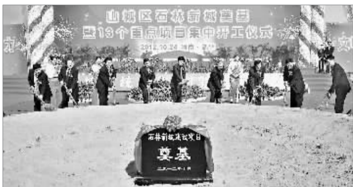
山城区石林新城奠基。

石林新城计划用5年时间建成,届时,一个配套齐全、功能完善、宜业宜居、可入住10万以上人口的新城区将矗立在山城区东部。