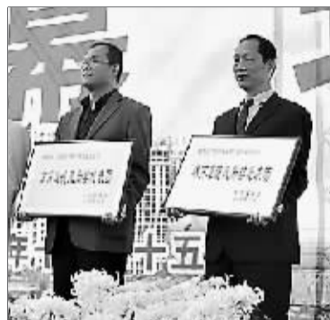
市九运会昨日闭幕,图为获奖代表上台领奖。

晨报讯(记者 李丹丹)经过两个月的紧张比赛,10月25日上午9时,“淇河酒业杯”市九运会闭幕式在淇滨区新世纪广场隆重举行。