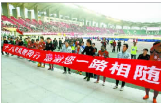
赛后建业球员拉出横幅感谢球迷。

建业的降级对于主帅沈祥福来说也是个不小的打击,这位三个月前还很有自信的前国字号教练,赛后承认自己的工作失败了。对于建业的种种问题,沈祥福表示,此前他从来没