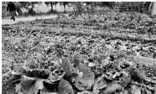
海棠巷人行道上的菜地。

晨报讯(见习记者 王凤娇 马龙歌)10月31日,热心市民拨打本报热线反映,淇滨区海棠巷与嵩山路交叉口西侧的人行道上有几块菜地,不仅给市民的正常出行带来诸多不便,也影响了市容市貌。