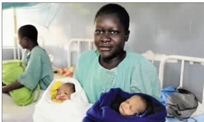
欧瓦抱着双胞胎儿子。

据台湾“联合新闻网”11月9日援引英国《每日邮报》报道,经过数月鏖战,美国总统奥巴马终于在11月7日击败罗姆尼,赢得连任。肯尼亚一名妇女正巧于7日产下一对双胞胎儿子,她为儿子们取名为奥巴马及罗姆尼。