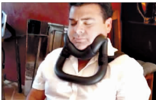
“贪睡支架”能让你坐直了睡觉。

据英国《每日邮报》11月7日报道,美国一家公司近日推出一款“贪睡支架”,人们能在旅途中借助它坐着睡觉了。