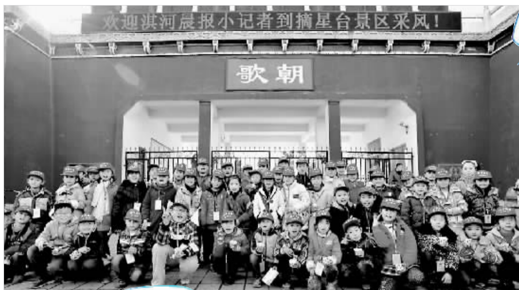
部分小记者 在摘星台景区门口合影留念。