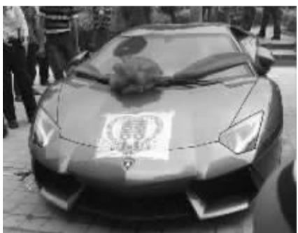
嫁妆中的一辆兰博基尼。