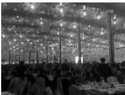
席开400多桌，据说一桌8000元。

“晋江百宏集团老板嫁女儿，嫁妆2亿多元，再次刷新了福建嫁女陪嫁纪录！”这两天，类似的信息频频出现在微博及福建本地一些知名论坛上，引发网友羡慕嫉妒恨，“抢银行，不如娶个晋江新娘”成了热门话题。