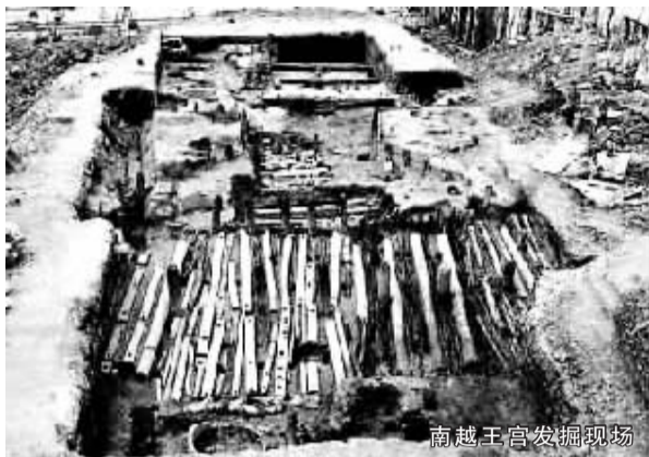
南越王宫发掘现场

为纪念“中国文化遗产日”，央视科教频道将在6月9日推出《中国记忆——文化遗产博览月》之“6·09大型直播节目”。该节目的总导演阎东近日透露，此次直播长达4个小时，将向观众呈现陕西韩城梁带村、成