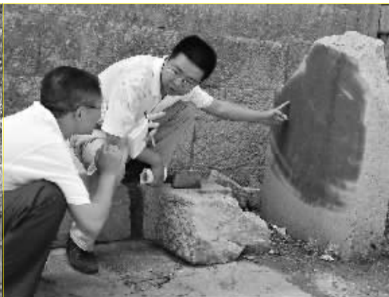
孙真人洞外的残碑。