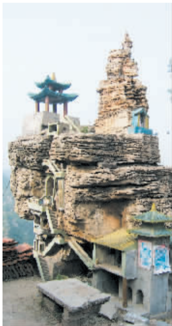
▲无影山。 ▼盘龙山古军营遗址。