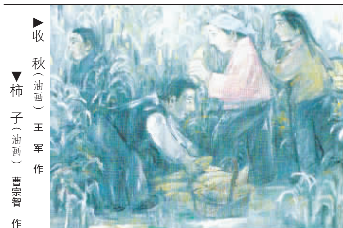
收秋(油画) 王军作 柿子(油画) 曹宗智作

以后每年的“五一”前后,给妈妈打电话问安时,她总是那句话:“樱桃快熟了,你们有时间来吃樱桃吧!”我从“吃樱桃”的话语里读懂了那句话的真正含义,也有了无尽希望。我也会把樱桃的故事讲给我的孩子听。