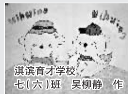
淇滨育才学校 七(六)班 吴柳静 作