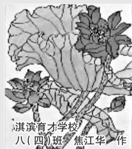
淇滨育才学校 八(四)班 焦江华 作