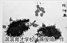
淇滨育才学校 蒋俊琦 作