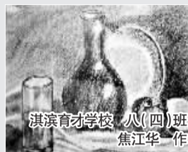
淇滨育才学校 八(四)班 焦江华 作