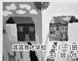
淇滨育才学校 七(一)班 王燮 作