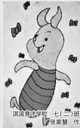
淇滨育才学校 七(二)班 张家慧 作