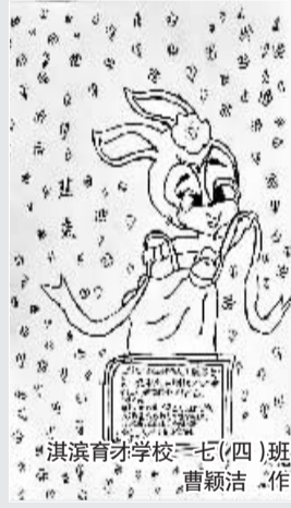
淇滨育才学校 七(四)班 曹颖洁 作

供稿: 淇滨育才学校《淇滨晚报》小记者站 总策划:孙文清 张振军 李广文 田长海 执行:田长海 张钰 白燕清