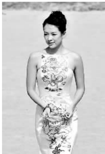
章子怡穿旗袍 亮相希腊

希腊当地时间3月24日,2008年北京奥运会圣火采集仪式在古奥林匹亚竞技场举行。作为希腊奥委会的特邀嘉宾,中国著名影星章子怡身着极具中国韵味的丝绸礼服出席圣火采集仪式。 (据新华网)