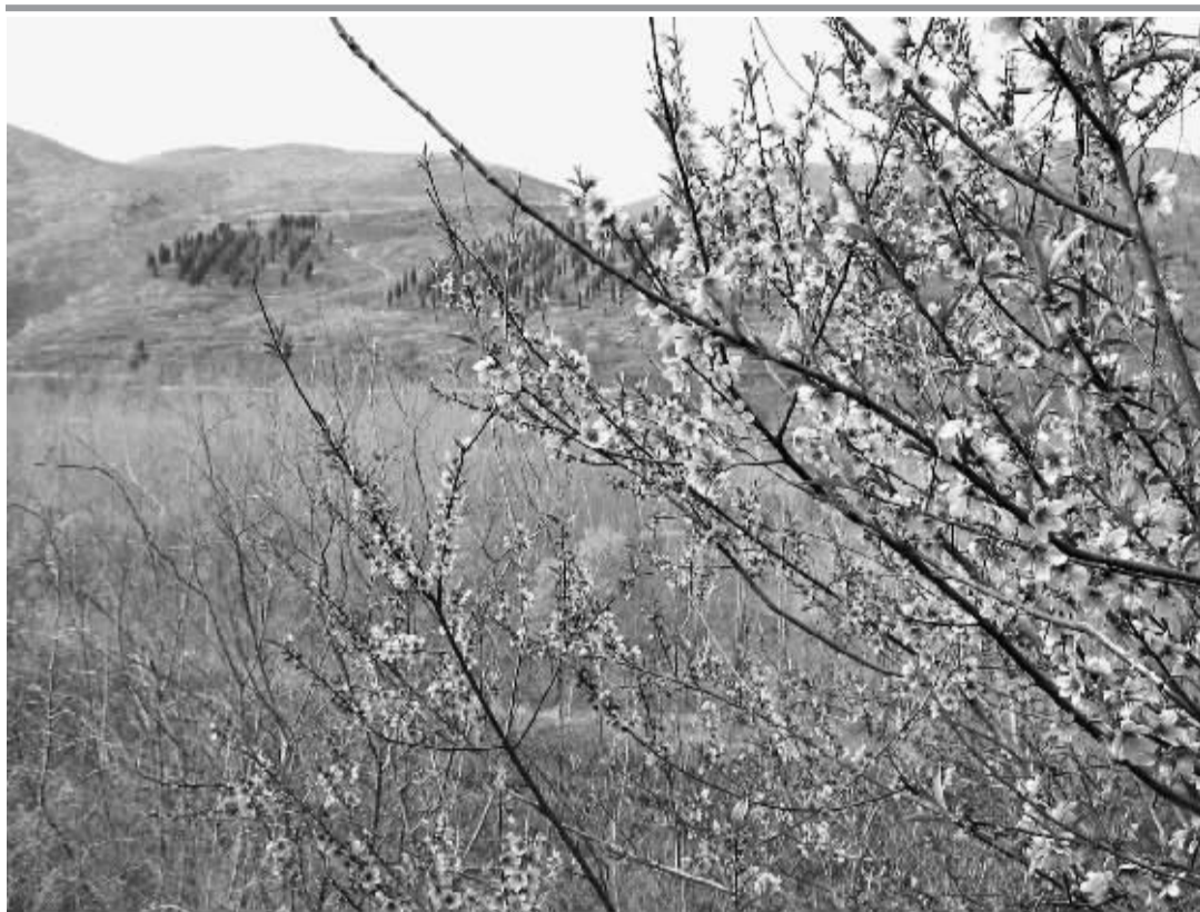
桃花朵朵开 师范附小五三班 孙晨丹 摄