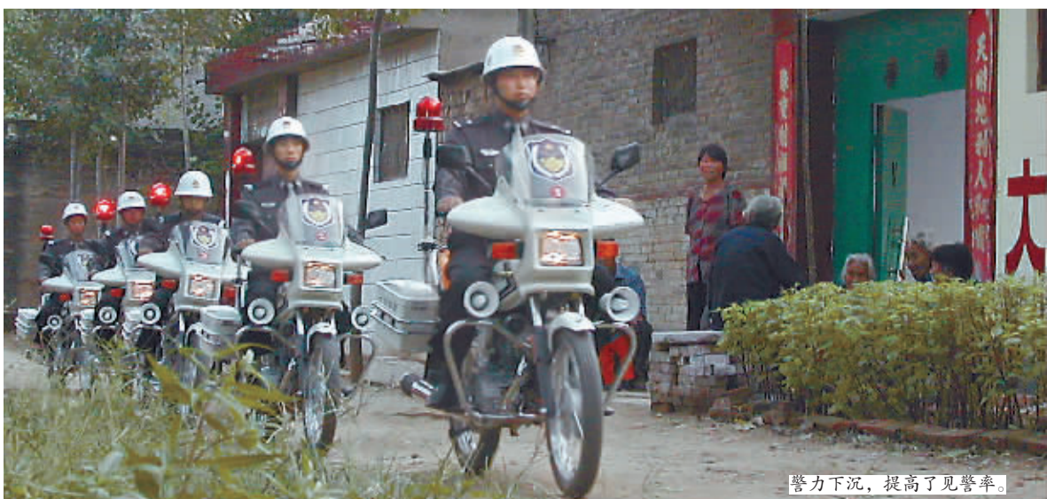
警力下沉,提高了见警率。