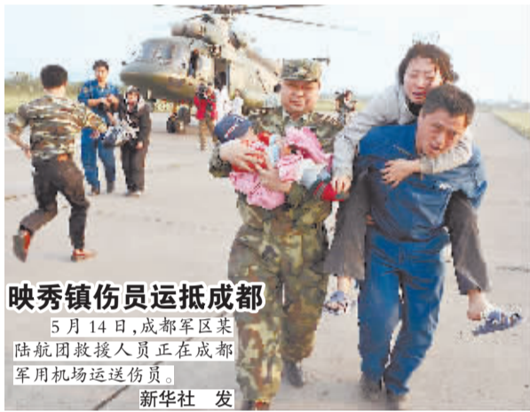
映秀镇伤员运抵成都 5月14日，成都军区某陆航团救援人员正在成都军用机场运送伤员。